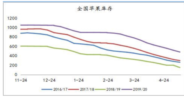
图 1：全国苹果库存走势图 单位：万吨