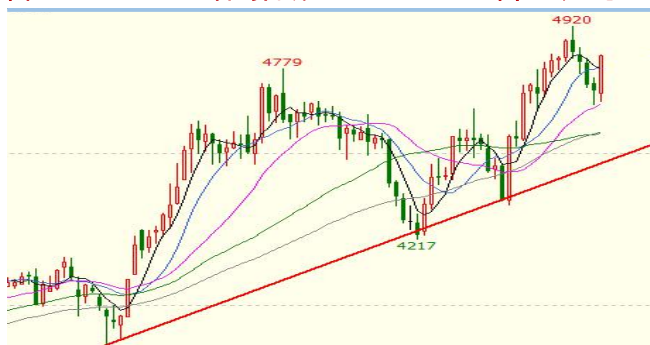
图 1：豆一 A2009 合约日线 单位：元/吨

豆一在修改交割规则后备受市场资金的青睐，从 A2005 合约开始，豆一便开启了爬坡之路，用仅仅半年时间上涨了近 50%，之后 A2009 合约延续了 05 合约的强势，在回调一段时间后再攀高峰。主要因为 6 月 12 日，中储粮终于开启陈粮大豆拍卖，三轮拍卖均快速售罄，足以见市场粮源紧张程度，使得豆一期货价格强势运行。6 月 19 日，A2009 合约最高涨至 4920，较 6 月 8 日的低位 4330 上涨了 13.6%，较 5 月底的低点 4217 上涨了 16.7%。6 月 29 日，豆一在节前小幅回调后再次拉涨，强势不减。