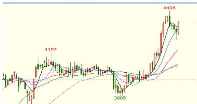
图 2：豆一 A2101 合约日线 单位：元/吨