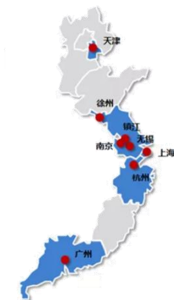
表 1 上海期货交易所螺纹钢指定交割仓库