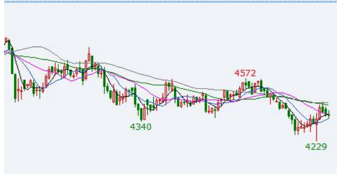
图：今年 4 月以来鸡蛋 JD2201 合约走势 单位：元/500 千克